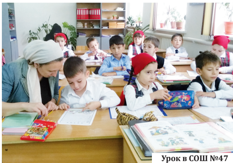
Урок в СОШ №47

В ходе состоявшейся ежегодной Августовской педагогической конференции прошло награждение победителей и призеров регионального этапа VIII Всероссийского конкурса «Лучшая инклюзивная школа России-2021» и регионального этапа IV Всероссийского конкурса профессионального мастера «Учитель-дефектолог России-2021».