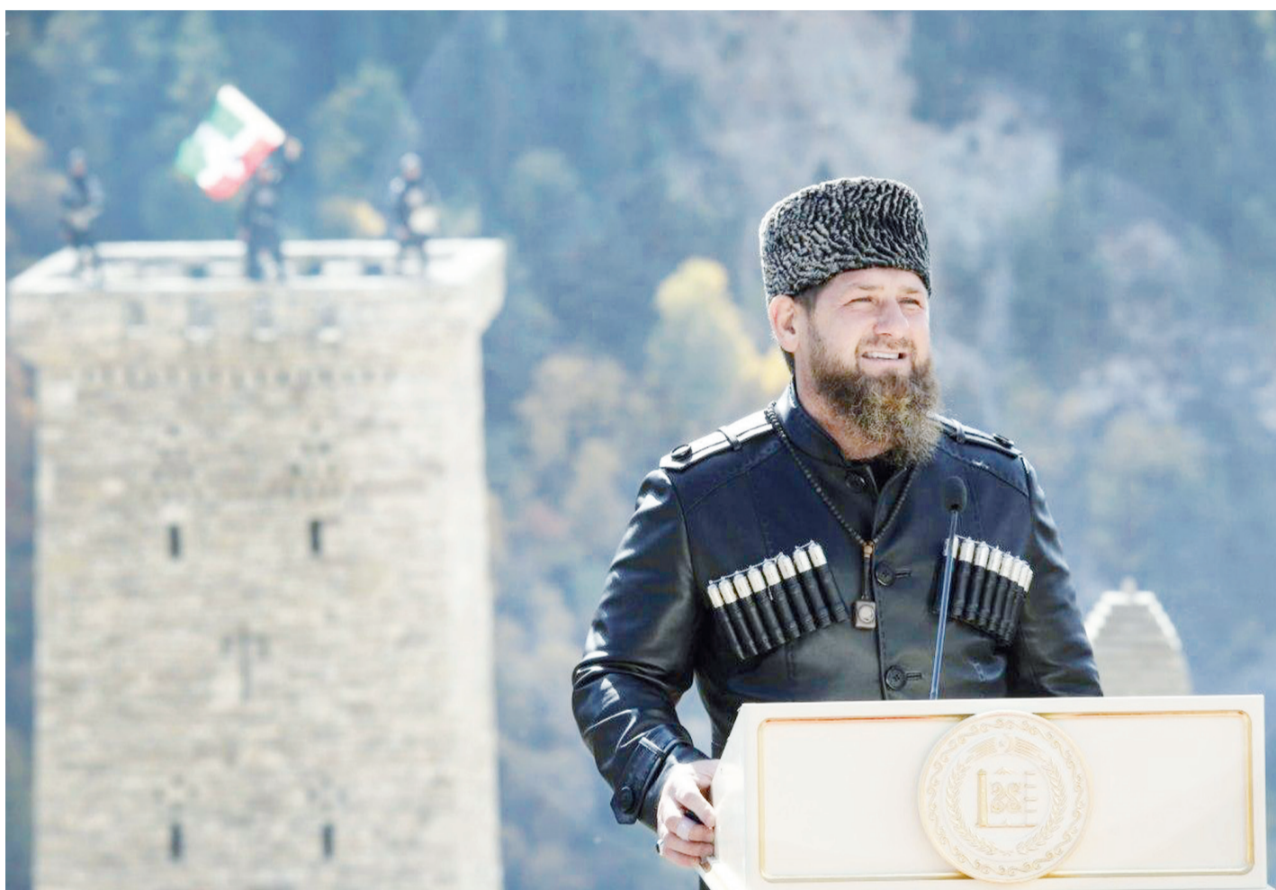
Глава Чеченской Республики Рамзан Кадыров принял участие в торжественной церемонии открытия восстановленного историко-архитектурного комплекса «Хой».