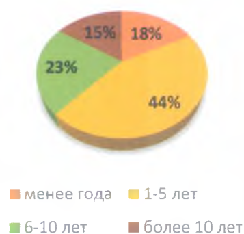
Стаж работы в должности

Анализ кадрового состава по стажу педагогической работы показывает, что наибольшую долю из общего числа сотрудников составляют специалисты со стажем более 20 лет педагогической работы (37%), доля специалистов, не имеющих стажа педагогической работы, составляет - 23%. Данный анализ позволяет сделать вывод о том, что к работе в ММС привлекаются преимущественно специалисты, имеющие опыт педагогической работы, их доля составляет 77% от общего числа кадрового состава муниципальных методических кабинетов республики, но следует обратить внимание на то, что почти четверть штатных сотрудников ММС не имеют стажа педагогической работы, что несомненно влияет на качество кадрового состава в целом.